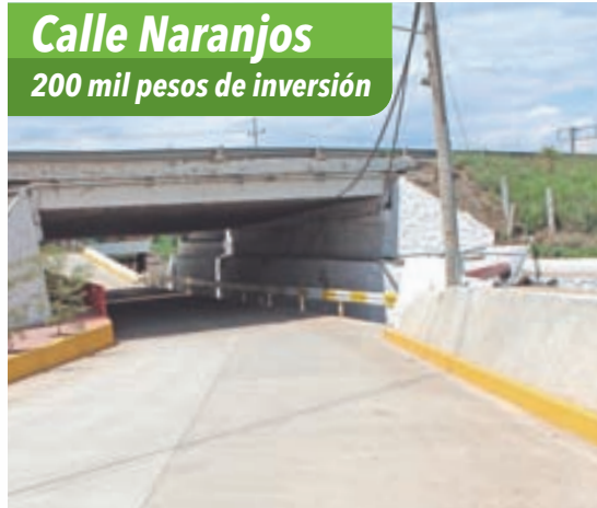
Calle Naranjos 200 mil pesos de inversión

La inversión aproximada, en la calle López Rayó fue de más de 12 millones de pesos en 1.2 kilómetros.