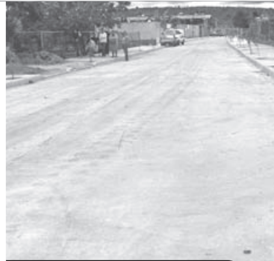
Calle El Pedregal, delegación La Purísima

EN ZAPOTLANEJO , la calle López Rayón es una de las vialidades más extensas, con más de 1.2 kilómetros, esta distancia fue completamente remodelada con una inversión superior a los 12 millones de pesos.