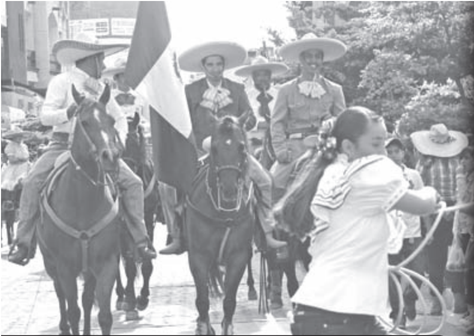
Los Charros de Zapotlanejo participaron durante el desfile que conmemora su día.

La noche del 15 de septiembre, el primer edil de Zapotlanejo, LCP Francisco Javier Pulido Álvarez, encabezó el Grito de Independencia, ante miles de zapotlanejenses en la explanada principal.