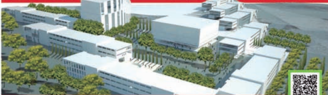
Proyección de obra del nuevo Centro Universitario Zapotlanejo.