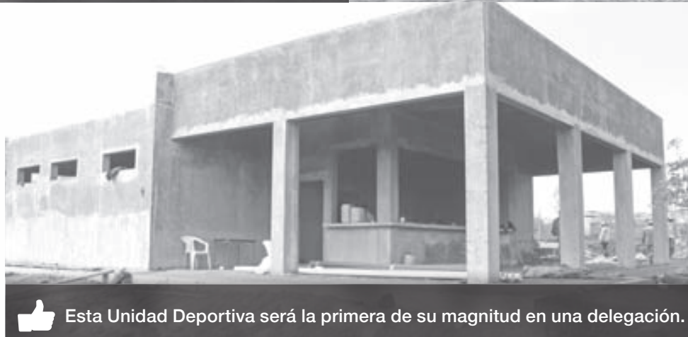
👍 Esta Unidad Deportiva será la primera de su magnitud en una delegación.

Para esta construcción se destinaron aproximadamente cinco millones 560 mil pesos, en donde también se pretende construir un andador de concreto estampado, canchas de basquetbol, un estacionamiento e iluminación.