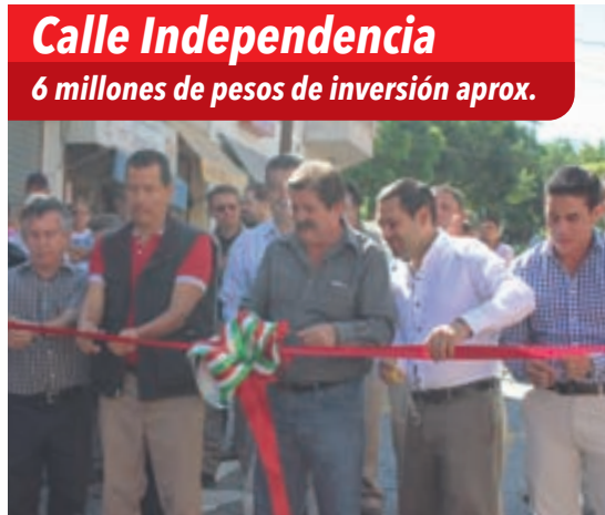
Calle Independencia 6 millones de pesos de inversión aprox.