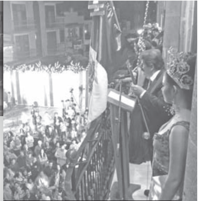
El presidente municipal, LCP Francisco Javier Pulido Álvarez, encabezó el Grito de Independencia.

Con la tradicional pega de programas las autoridades municipales dieron inicio a las fiestas patrias 2014, para conmemorar el 204 aniversario de la gesta heroica.