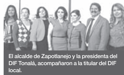
El alcalde de Zapotlanejo y la presidenta del DIF Tonalá, acompañaron a la titular del DIF local.