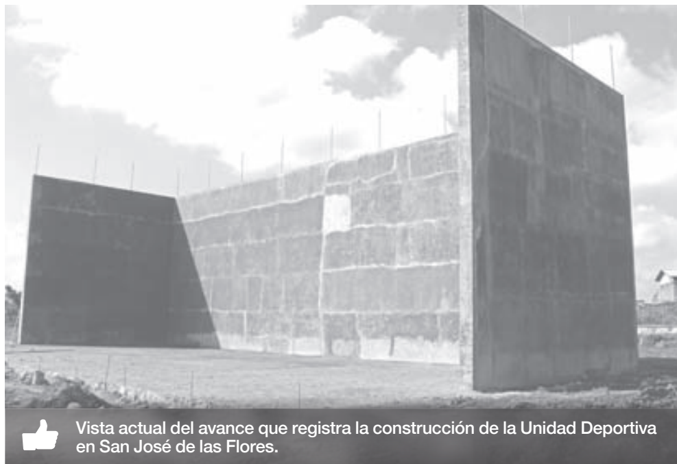
👍 Vista actual del avance que registra la construcción de la Unidad Deportiva en San José de las Flores.

Con estas acciones el Gobierno Municipal de Zapotlanejo quiere que la población haga uso de ellas y sea un espacio de esparcimiento para la práctica deportiva y la sana convivencia familiar.