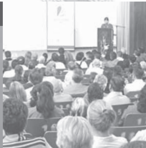
Cerca de 300 personas acompañaron a la titular del DIF Municipal durante su 2do. Informe de Actividades.

localidades y la cabecera, durante 203 días del ciclo 2013-2014.