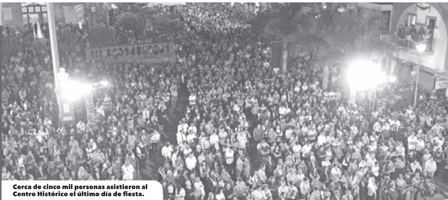
Cerca de cinco mil personas asistieron al Centro Histórico el último día de fiesta.

Las actividades tuvieron como objetivo, la finalidad de que la población en general continúe retomando las tradiciones ya que las comunidades que comprende el municipio celebran esta festividad con gran participación ciudadana.