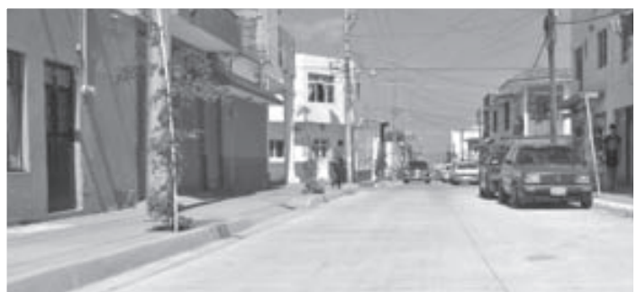
Calle López Rayón recién remodelada, en la cabecera municipal.