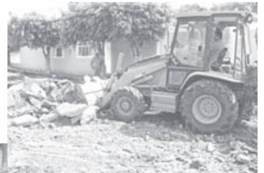
Trabajos de empedrado en la calle Jalisco.

A través de estas acciones el Gobierno Municipal de Zapotlanejo tiene como objetivo mejorar las condiciones de la infraestructura sanitaria en beneficio de la población ya que esto es una prioridad en la vida cotidiana de los ciudadanos, ya que estos son servicios básicos con los que debe contar.