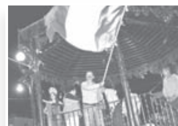
La Paz (Santa Fe)