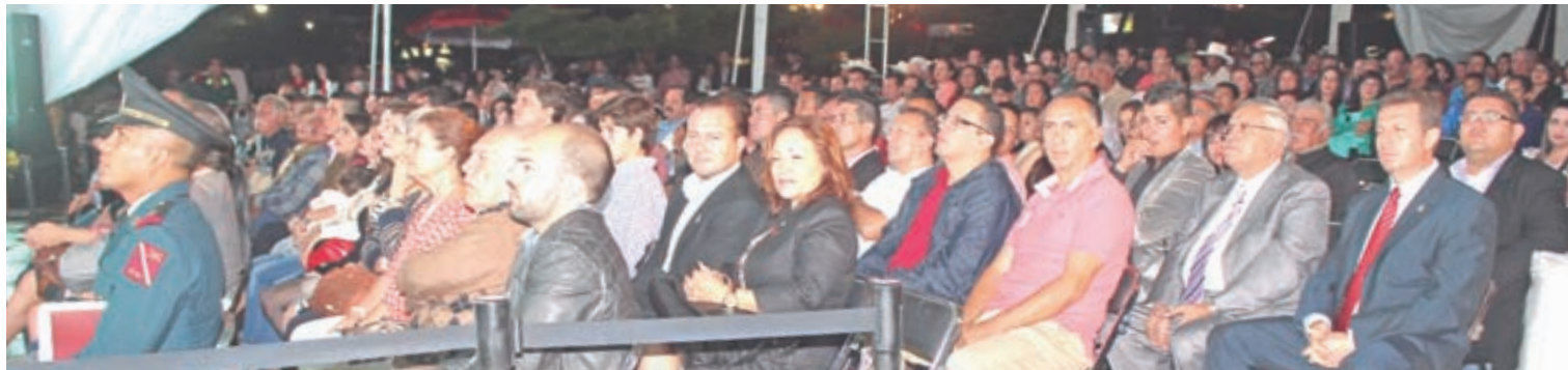
Cerca de 1,000 asistentes, asistieron al Segundo Informe de Resultados, para constatar las obras hechas por el gobierno municipal de Zapotlanejo

En el rubro educativo, señaló el implemento del servicio de transporte universitario con un autobús que lleva a estudiantes al Centro Universitario de la Ciénega en Ocotlán donde les permite ahorrar hasta dos mil seiscientos pesos mensuales a cada una de sus familias.