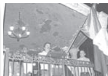
San José de las Flores