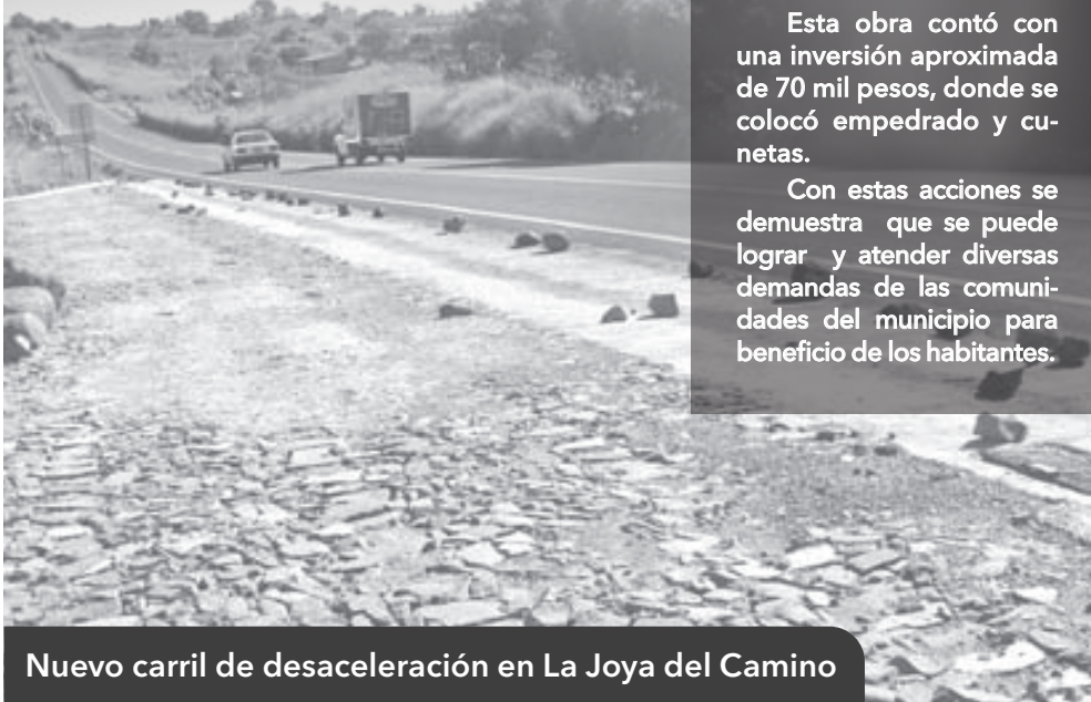
Nuevo carril de desaceleración en La Joya del Camino

Con estas acciones se demuestra que se puede lograr y atender diversas demandas de las comunidades del municipio para beneficio de los habitantes.