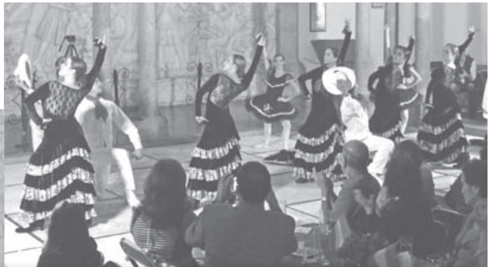
EN ZAPOTLANEJO, se llevó a cabo un evento de talla internacional, la combinación del folclor mexicano y español, interpretado por Las Cabaes, A.C.