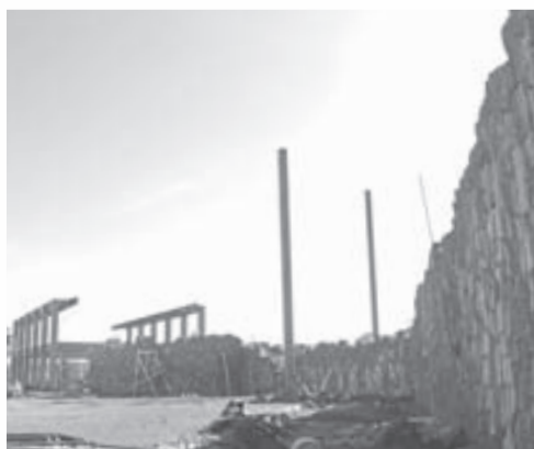
EN PUENTE DE CALDERÓN avanza la construcción de la primera etapa del Museo de Sitio.

el desarrollo económico en el municipio, además de un detonante turístico importante en la región.