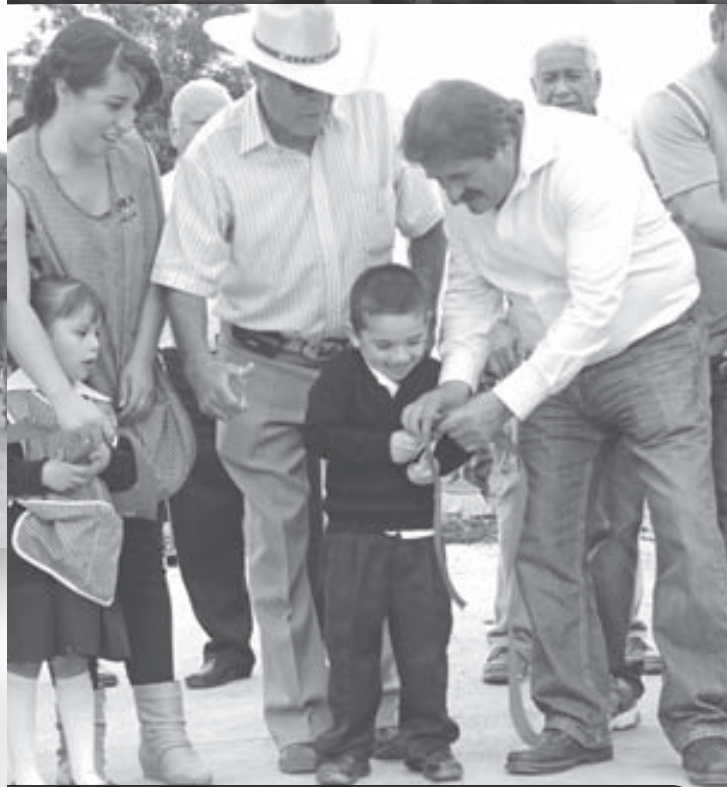
Los niños de La Purísima, también participaron en el corte de listón de la calle El Pedregal.

EN LA PURÍSIMA , decenas de personas acudieron a realizar el corte listón para abrir al tránsito la calle El Pedregal. Además expresaron su agradecimiento al gobierno municipal por mantenerse de cerca en las necesidades de los pobladores.